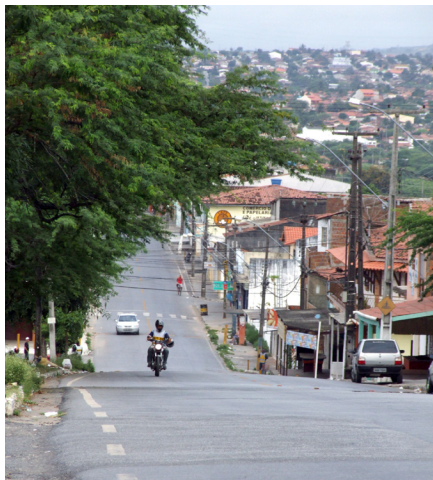
Imagem 01: Rua do Sol: coração do Santa Rosa

como farmácias, padarias e bares, que juntamente a instituições como a Sociedade Amigos do Bairro – SAB Santa Rosa, a Escola Municipal Tiradentes e a Unidade Básica de Saúde Adriana Bezerra de Carvalho, atendem os moradores do bairro no seu cotidiano.